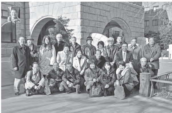
第16期 神奈川県民協議会 施設見学会 2011年1月28日(金) 横浜地方裁判所

横浜地方裁判所では、裁判についての説明を受け、裁判の種類や流れなどについて学ぶことができました。実際に裁判の傍聴をしましたが、TVドラマとは違った現実を目の当たりにし、参加者それぞれ感じるどころがありました。裁判官、検察官、弁護士、被告人のやり取りを見、万が一自分や関係者がそのような立場になった場合はどのように対処するべきかを学べる良い機会となりました。傍聴した裁判は、この日が初日とのことでしたが、比較的軽量事犯であり、また、被告人、弁護士に争う論点がないことから、この一日で全ての流れが進んで行き、人定質問から弁論終結まで1時間程度で終わりました。