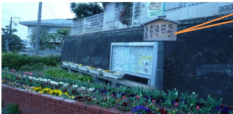
「時代劇の掲示板」 に注目