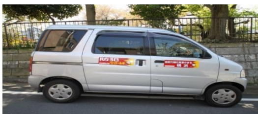
参考：商用車にステッカーを貼った状況

神奈川警察署指示のステッカーは、導入する町会の希望を聞き 3 種類あるステッカーを組み合わせて対応します。